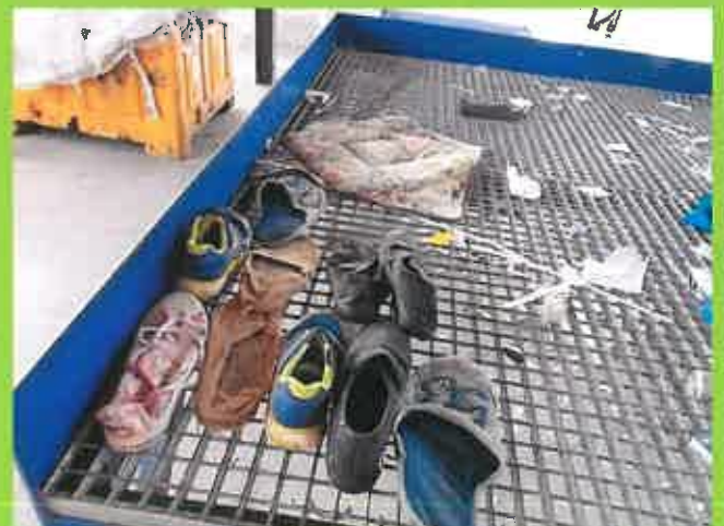
Objets retrouvés dans une borne de corps plat (bleu)

La majorité de ces déchets pourrait être traitée en déchetterie !!!