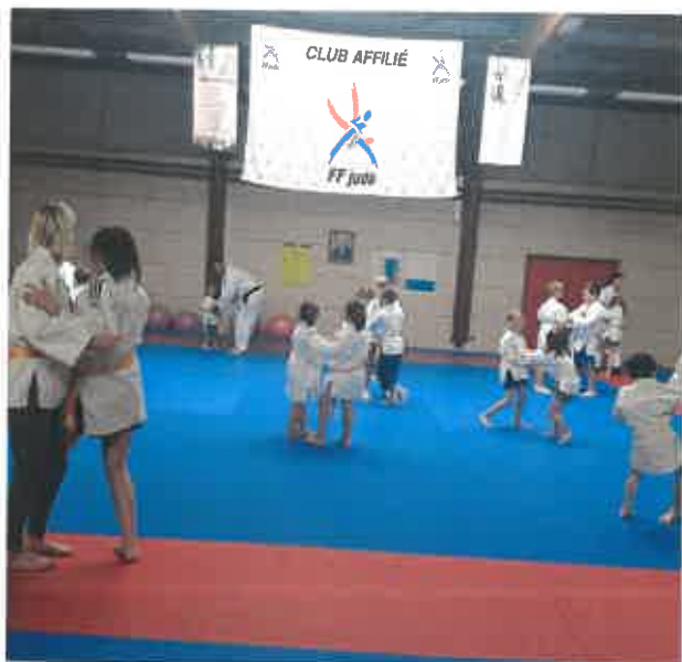
Semaine sportive (3 - 12ans) : cours de Judo

Retour sur un été chargé en activités et émotions !