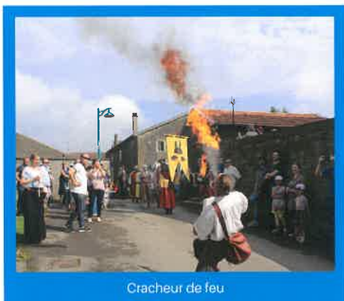
Cracheur de feu

Près de 400 personnes ont profité de cette journée pour suivre des visites guidées de l'église fortifiée et de son espace muséographique.