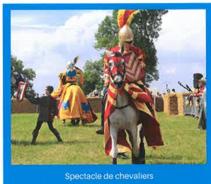
Spectacle de chevaliers