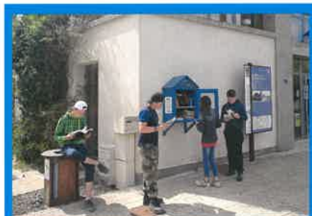
Promotion de la Boîte aux Livres auprès des ados

La « boîte aux livres » est installée sur le mur extérieur des locaux de la CODECOM, 3 place Louis Bertrand à Spincourt. »