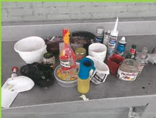
Objets retrouvés dans une borne de corps creux (jaune)

1 tonne de refus coûte 113,40€ , si les échantillons prélevés continuent à être aussi mauvais, les aides perçues par la Communauté de Communes vont baisser alors seule la redevance pourra compenser cette perte.