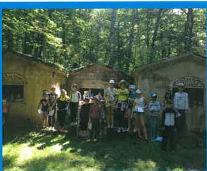
Les élèves au Camp Marguerre

Les classes de CE2, CM1 et CM2 de l'école de Rouvrois-sur-Othain ont passé une journée à découvrir les trésors cachés du territoire. Cette journée organisée par l'Office de Tourisme les a amené à découvrir "Léni la chauve-souris" et "les Mystères du Camp Marguerre" (chasse au trésor), puis à visionner "Spincourt 14", film réalisé par les élèves de l'école de Spincourt en 2014 sur la Bataille de Frontières, avant de déguster des produits locaux et de passer une demi-journée avec des archéologues et les Amis de Senon, à la découverte des fouilles archéologiques réalisées en juin au Bourg de Senon. Plus de 70 élèves ont participé à cette journée et ont pique-niqué au chalet-refuge de Senon.