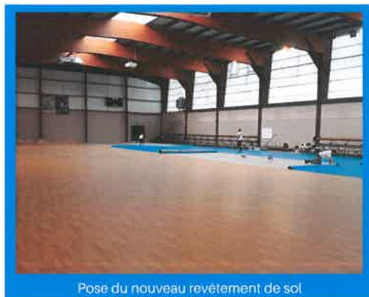
Pose du nouveau revêtement de sol

COMITÉ DÉPARTEMENTAL DES TERRITOIRES RURAUX