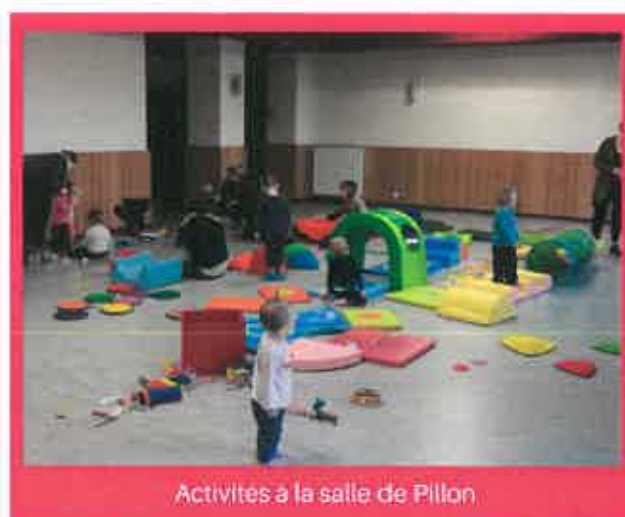
Activités à la salle de Pillon

Les enfants non scolarisés accompagnés de leur assistante maternelle ou de leurs parents sont les bienvenus aux matinées d'animations proposées par vos RAM. Ces rendez-vous hauts en couleurs permettent aux petits de se retrouver autour d'activités et de jeux adaptés à leur âge. A ces occasions, les animatrices mettent à disposition en prêt, des jeux de société, des jouets, des puzzles, mais aussi des albums, des revues, que les assistantes maternelles et les parents peuvent emprunter pour les tester à leur domicile avec les enfants.