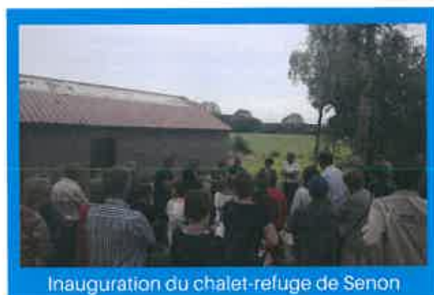
Inauguration du chalet-refuge de Senon

Enfin, dans le cadre de ce parcours de mémoire, le lavoir de Senon qui a été aménagé en chalet-refuge pour les randonneurs, a été inauguré ce même-jour.