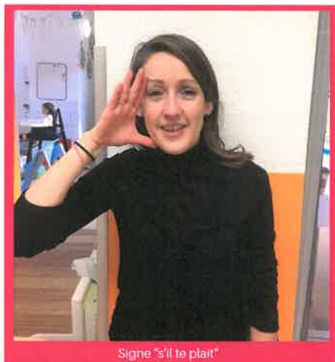
Signe "s'il te plaît"