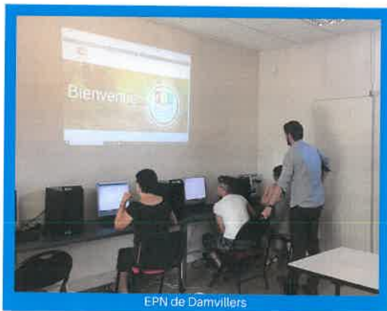
EPN de Damvillers

Nous sommes conscients que cette nouvelle révolution technologique peut engendrer de vraies difficultés pour une partie de la population. Aussi la Communauté de Communes a décidé de renforcer son action en la matière, en structurant des Espaces Publics Numériques (EPN), via des aides européennes LEADER. Les EPN seront à Damvillers et à Spincourt dans les locaux de la Communauté de Communes, en accès libre et gratuit pour tous. Des formations seront proposées sur diverses thématiques ! Enfin pour permettre aux personnes les plus isolées de bénéficier du service, un équipement mobile devrait être mis en place pour se rendre dans les communes au plus près de nos concitoyens.