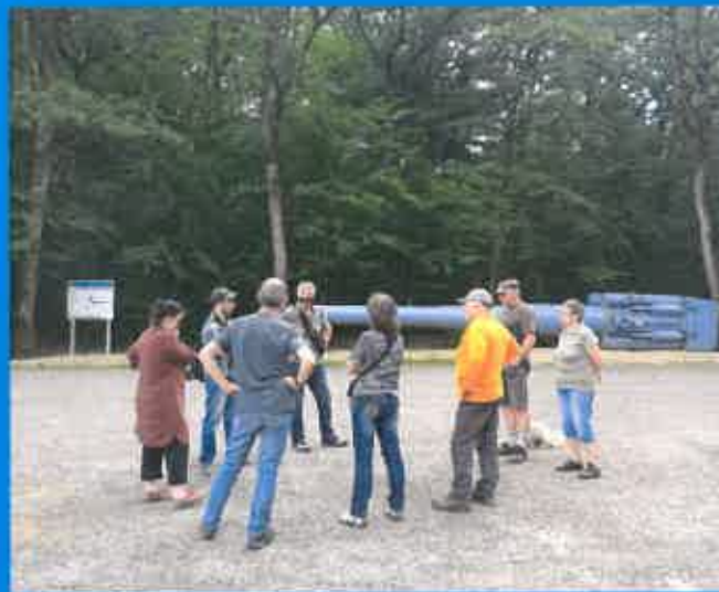
Visite du site du canon de Duzey