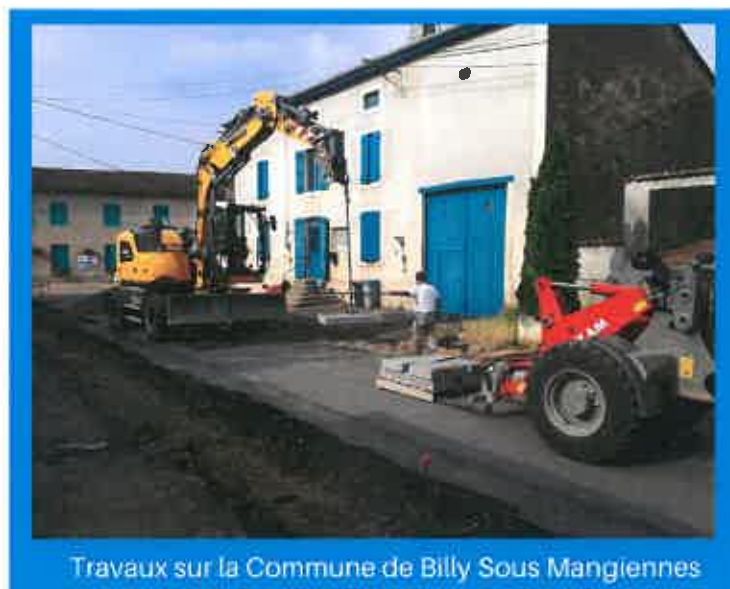
Travaux sur la Commune de Billy Sous Mangiennes

Comme chaque année un programme de travaux a été défini suite au passage de la commission voirie. De lourds travaux sont encore prévus et des choix ont donc été nécessaires. L'entreprise Colas a remporté ce nouveau marché de 703 868,20€ HT dont 487 648,50€ de travaux intercommunaux et 216 219,70€ de travaux communaux. Vous pourrez retrouver le détail de nos actions sur le site internet de la Communauté de Communes. Un nouveau marché de curage des fossés et de dérasement des accotements (sur 3 ans) a été attribué à l'entreprise Brabant et un marché de petit entretien à l'entreprise Chollet.