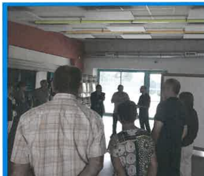
Participants aux Premières Assises de la Culture

Aussi, le GIDACT lancera dès septembre un comité de pilotage, avec les associations et les habitants volontaires, afin de trouver des réponses à ces défis.