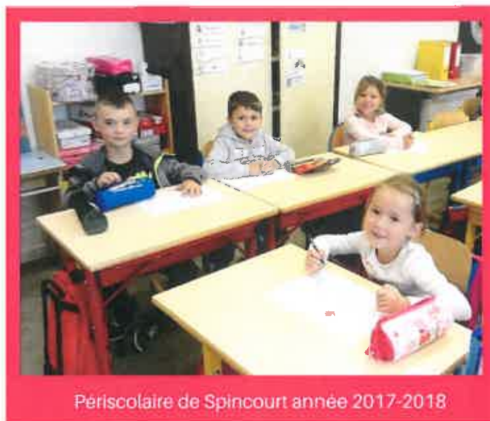
Périscolaire de Spincourt année 2017-2018

Concernant le périscolaire du matin et du soir, le site de Mangiennes verra ouvrir ce nouveau service à la rentrée. Un bilan de fréquentation réalisé en fin du premier trimestre nous permettra de dire si le service sera maintenu ou pas.