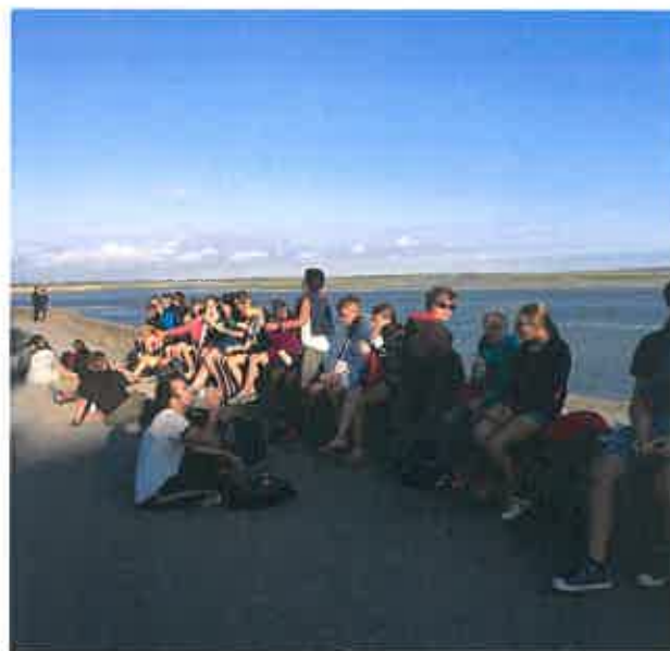
Voyage dans la baie de Somme pour les Ados